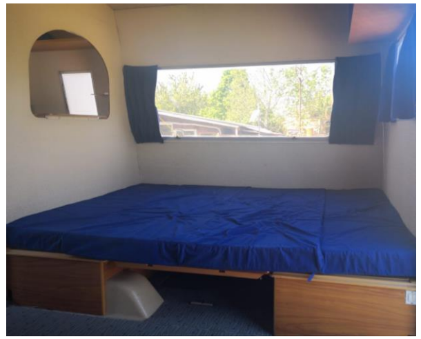
Eine der beiden Liegeflächen