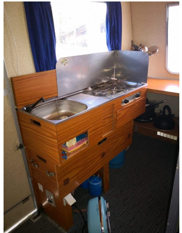
Innenküche mit Gasherd