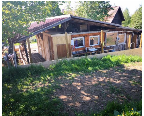
Sanitär-Gebäude: Dusche, WC, Abwaschstation