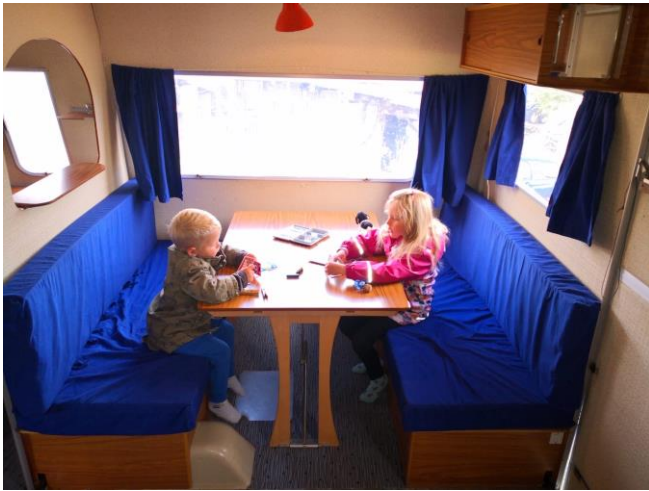
Essbereich kann in Liegefläche umgewandelt werden