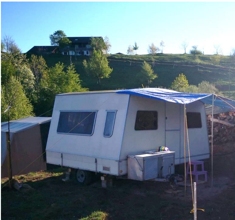
Klapp-Wohnanhänger mit gedecktem Vorplatz