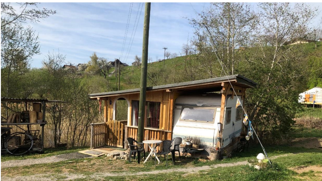
Der Weltenbummler – direkt am Hof-Seeli gelegen