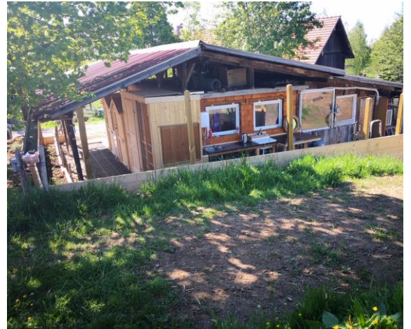
Dusche, WC, Abwaschstation von Aussen