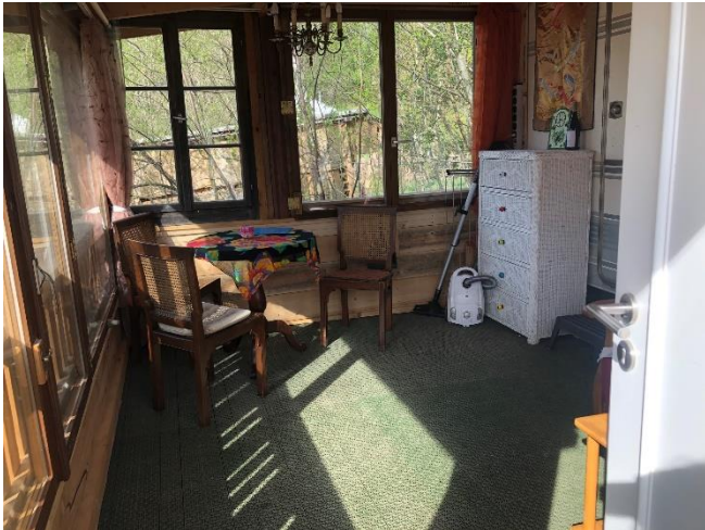
Gedekte, windgeschützte Terrasse