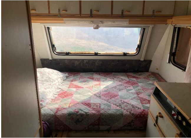
Innenraum mit Doppelbett