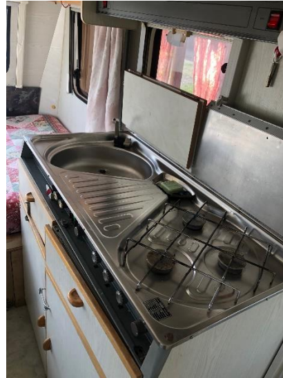
Praktische kleine Küche mit Gasherd