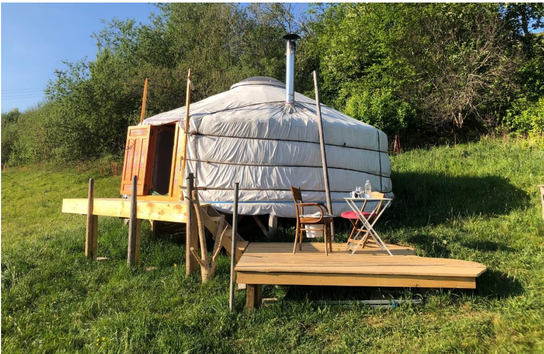
Gemütlicher Aussensitzplatz im Grünen