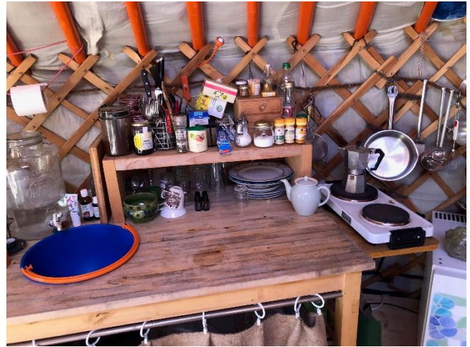
Innen-Küche (ohne fließendes Wasser)