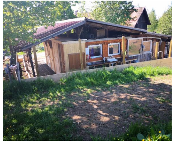
Dusche, WC, Abwaschstation von aussen