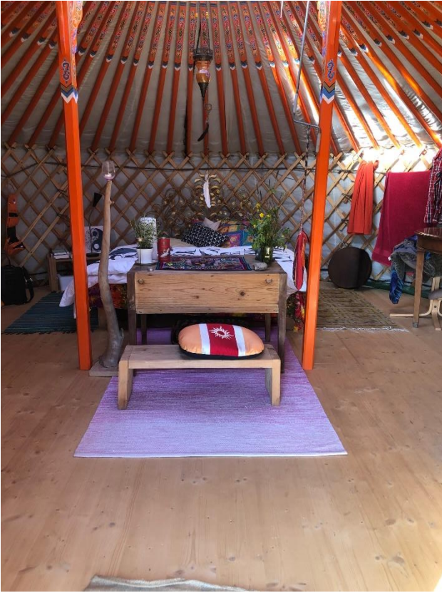
Innenraum mit Doppelbett