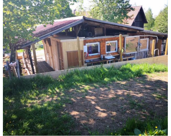
Dusche, WC, Abwaschstation von Aussen